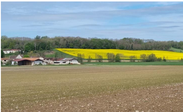
Champ de colza à Tigeaux