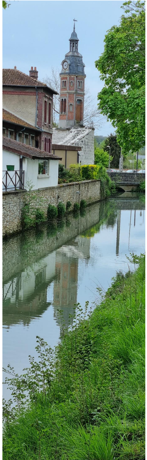
Le beffroi à Crécy la Chapelle