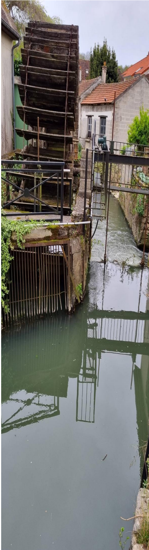
Roue de moulin sur un « brasset » à Crécy la Chapelle