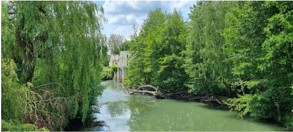
Grand Morin – Moulin de Coude