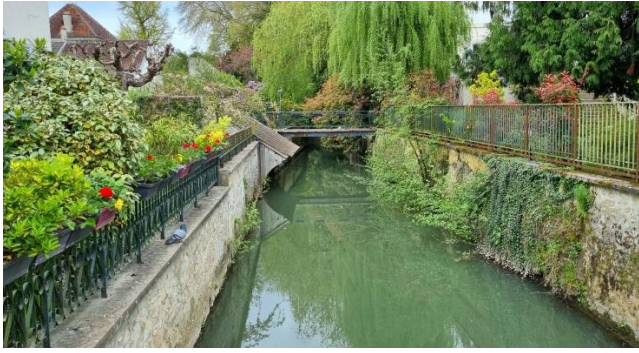
Canal ou « brasset » à Crécy la Chapelle