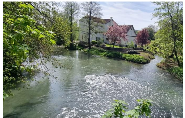
Grand Morin – Moulin de Prémol