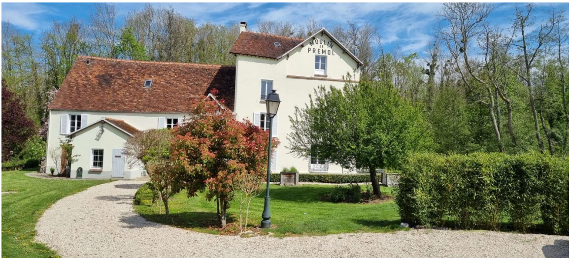
Moulin de Prémol