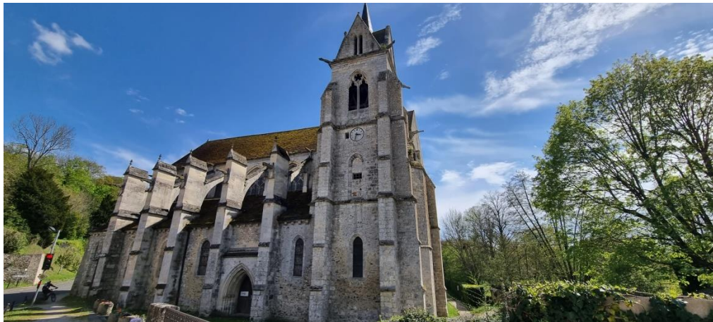
Eglise Notre-Dame de l'Assomption à La Chapelle sous Crécy