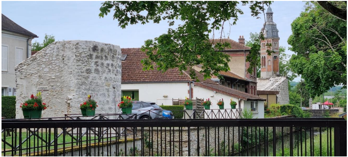
Porte de Meaux et le beffroi à Crécly la Chapelle