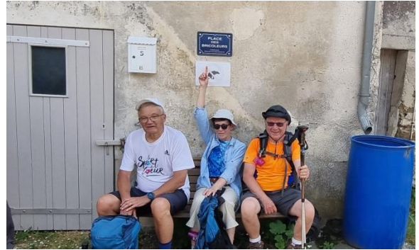
Les « bricoleurs » du dimanche à Serbonne ? Non les randonneurs au repos