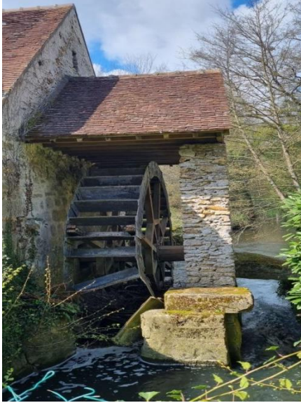
Roue du moulin de Laval