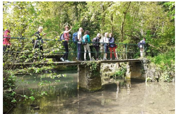
Passerelle sur l'Aubetin