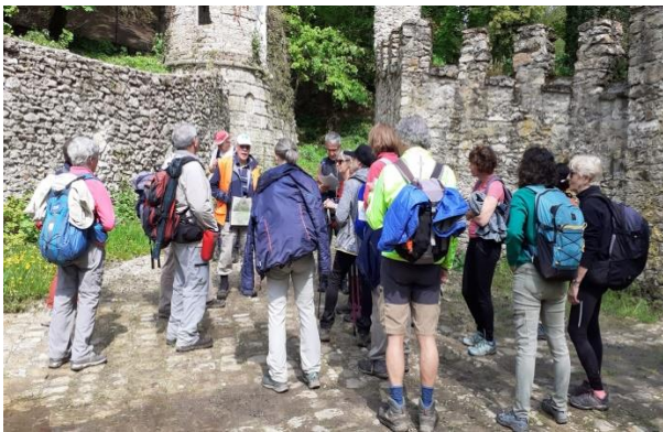
Au moulin de Laval