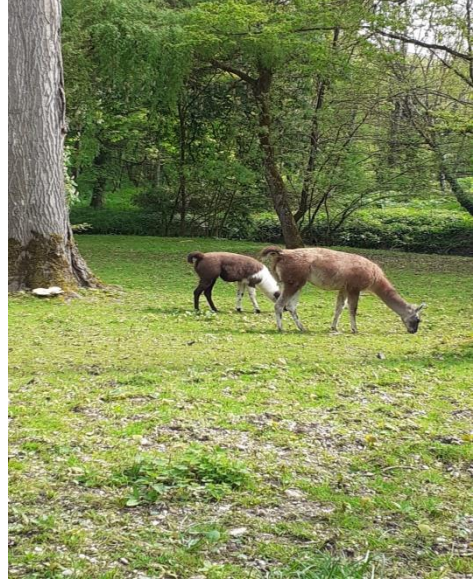
Vigognes au moulin de Laval