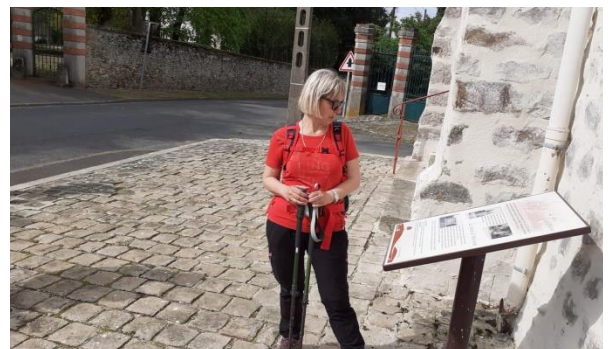
Lecture attentive devant l'église de Touquin