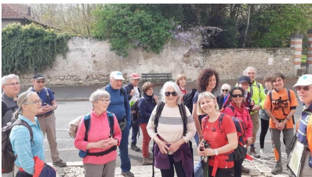
Arrivée à Touquin, devant l'église