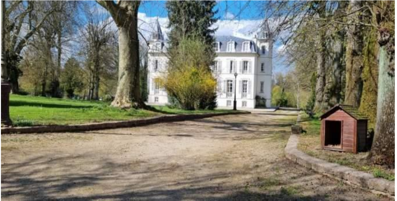
Château de Malvoisine à Touquin